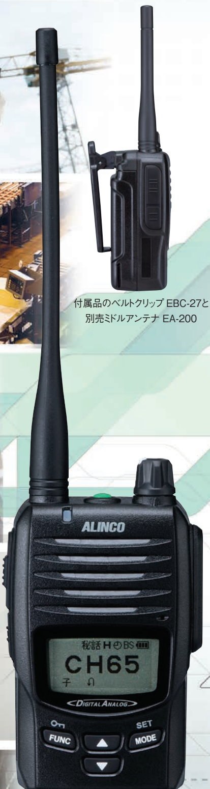
付属品のベルトクリップ EBC-27と別売ドールアンテナ EA-200