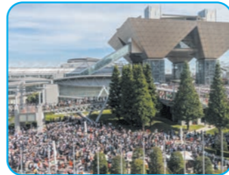
イベント・レジャー...