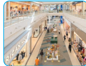
ショッピングモール...